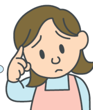
介護サービス従業者

〇〇さん、最近 元気がないし、体に不自然 なアザがあったり、なんだか 様子がおかしいなあ……。